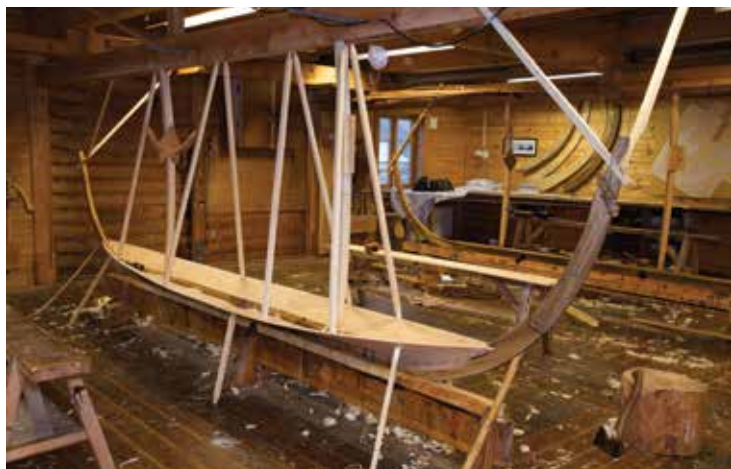
ORDBYGGJARKUNST: Her er «botnskapet» ferdig «omkringskote», og skordene står omfaret så det «held rette legget».

– Trebåten er nært på naturen. Naturen har sett premiss for korleis han kan sjå ut, han set premiss for materialet, og for kor langt ut på havet fiskaren kan ro. Det er noko finslipt ved strandebarmaren. Han er ein liten farkost på eit stort hav. Den gamle båten var også i bruk heile året. Han var ein transportmiddel som bilen i dag, og i ein puls det nesten er vanskeleg å førestilla seg.